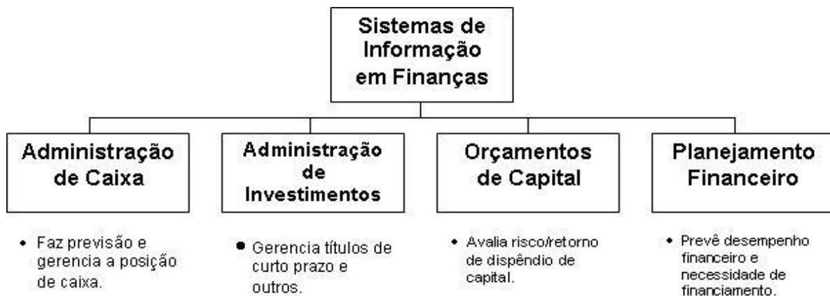
Figura 02 – Sistemas de Informação em Finanças

O Sistema de Informação em Finanças como vimos na fig. 02, demonstra a sua relação com diversas áreas da organização assim como Stair e Reynolds (2006) afirmam que um sistema de informação contábil executa inúmeras atividades importantes, fornecendo informações detalhadas sobre contas a pagar, contas a receber, folha de pagamento, orçamentos, além de outras aplicações, como sistema de custos responsável pelos gastos e receitas de uma organização.